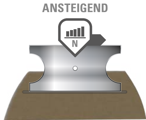
TDM-Test (ISO 13997:1999)